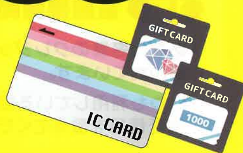
※電子マネーカードのイラストはイメージです。

コンビニ等で販売されている電子マネーカード... 被害者はこのように言われて、だまされて購入しています!